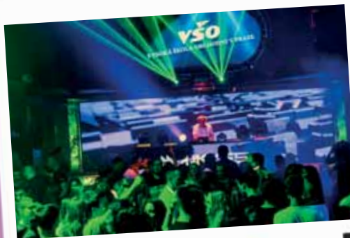
VŠO Welcome Party Retro Music Hall září 2021