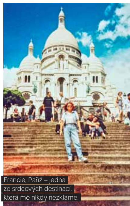
Francie, Paříž – jedna ze srdcových destinací, která mě nikdy nezklame.