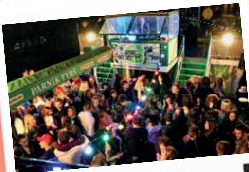
Boat Party Parník Tyrš květen 2022