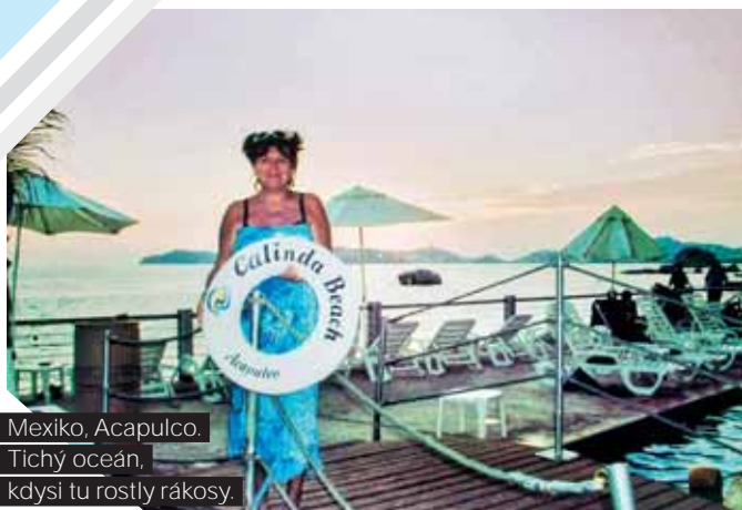
Mexiko, Acapulco. Tichý oceán, kdysi tu rostly rákosy.