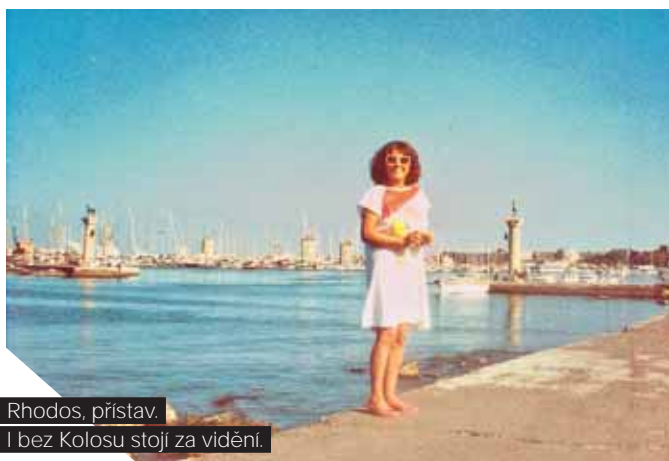
Rhodos, přístav. I bez Kolosu stojí za vidění.