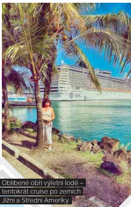
Oblíbené obří výletní lodě – tentokrát cruise po zemích Jižní a Střední Ameriky.

V dnešní době už není důležité, co studujete, protože pracovní trh je velice promíchaný. Takže není striktně dané, že z našich absolventů nutně musí být průvodci. Někdo to má třeba jako druhou profesi, jako hobby. Na druhou stranu se očekává, že průvodcovská činnost jako taková bude patřit mezi nadstandardní služby. To znamená, že nebude součástí běžného turistického balíčku, ale bude nutné si je objednat navíc. Průvodcovství bude vysoce profesionální, kvalifikovaná, elitní služba a zaplatí si ji jen ten, kdo o ni skutečně bude mít zájem. Nebude to tedy už jako dnes, kdy výklad zajímá pouze někoho a ostatní vyrušují. Myslím, že to také povede ke zkvalitňování průvodcovských služeb a zaměření se na vybranou klientelu. A i proto budou mít naši absolventi kvalitní a všestranné vzdělávání v rámci MBA. ◀