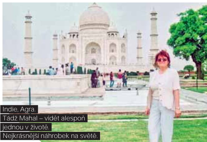
Indie, Agra. Tádž Mahal – vidět alespoň jednou v životě. Nejkrásnější náhrobek na světě.