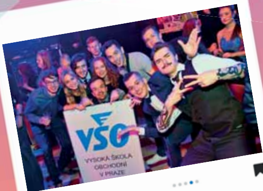
(Vánoční) Partyples 2021 prosinec 2021