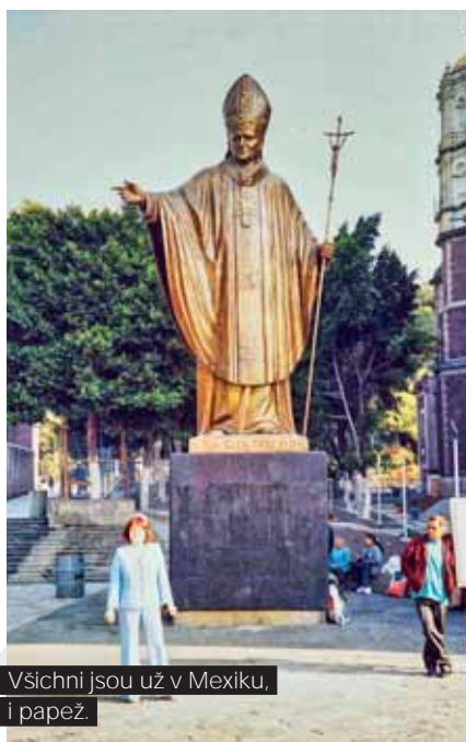
Všichni jsou už v Mexiku, i papež.