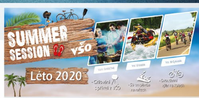
VŠO SUMMER SESSION Grill&Chill / Vodák / Kola Léto 2020