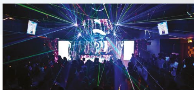
Partyples 2019 Phenomen Music Bar Listopad 2019